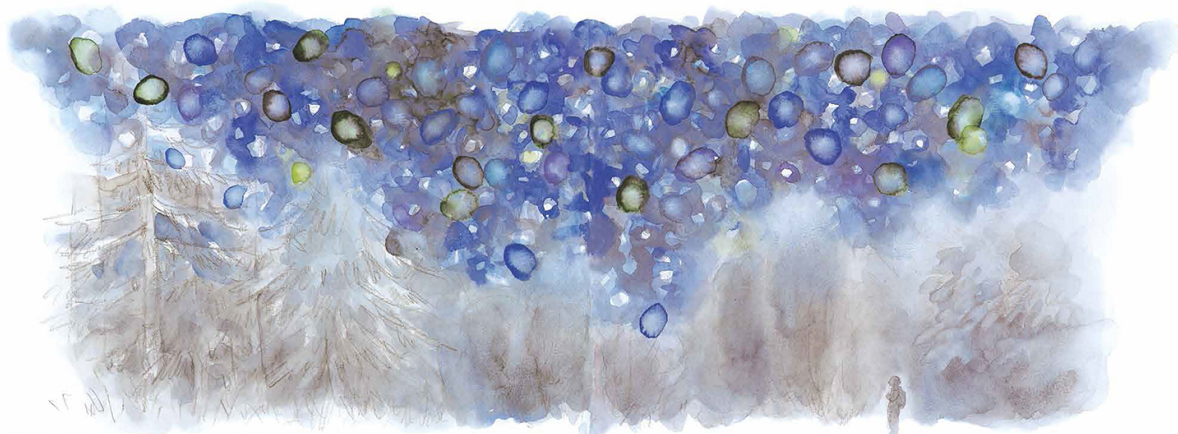
L'éclat d'étoiles nées avant l'homme a voyagé des milliers et des millions d'années-lumière avant de briller dans notre ciel.

Edita © Hideko Ise 2017 / Hebronnia Limited, Publishers