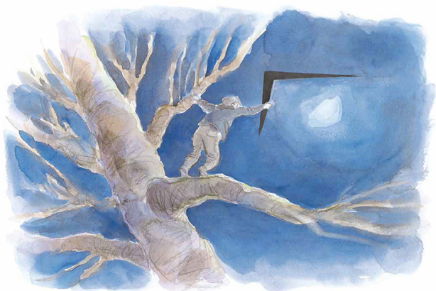
À moi la lune !

Hideko Ise, Myriam Dartois-Ako (trad. du japonais), La chambre du peintre, nobi nobi , 2017, 56 p., 13,50 €.